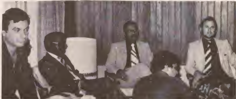
Na yegada aki na Aruba, e delegacion Arubano a ofrece un conferencia di prensa den V.I.P. room na aeropuerto.

Awor Aruba lo keda mira minuciosamente ki pasonan Hulanda lo bay tumar y cu si Hulanda lo cumpli cu local ela combini, esta di manda un ministro Aruba pa bin papia tocante e futuro estatal di Aruba. E resultado di e reunion aki lo wordo presenta na e Parlamento di Aruba pa forma un comision mixto di no solamente politiconan pero tambe di tur sector den nos comunidad pa asina cuminsa cu e preparacionnan pa e independencia di Aruba.